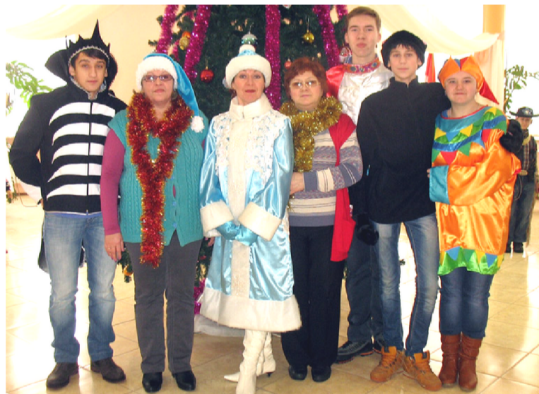
Команда, организовавшая праздник детям.

О чем речь? В этих школах проведены ремонтные работы для оборудования их пандусами, поручнями для